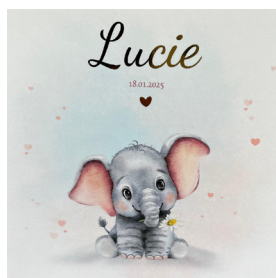
Lucie Kemp, dochter van Bonita en Rolf, geboren 18 januari 2025